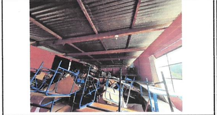
En esta fotografia se puede apreciar, el deterioro de la madera.