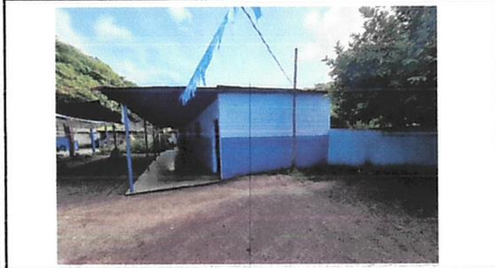
Foto1: El techo esta deteriorado, de mas de 40 años de uso, la lamina cuenta con corrosion