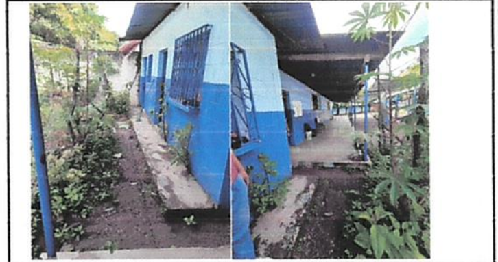
Esta es el area de cocina, donde se puede ver el estado del techo como asi la altura que es demasiado baja.