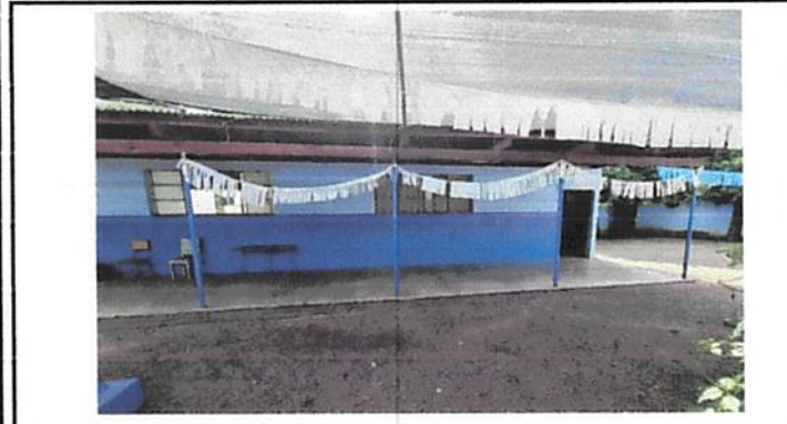
esta es la parte frontal de dos modulos con madera en mal estado, como asi también la lámina